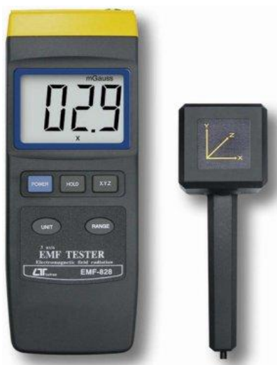
מכשיר לוטרון EMF-828 עם גלאי חיצוני